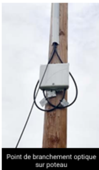
Point de branchement optique sur poteau

Vous pouvez vérifier sur le site d'éligibilité de NATHD ( www.nathd.fr/eligibilite ) si votre adresse a bien été référencée : si une pastille verte apparaît sur votre habitation, alors oui, vous êtes éligible à la fibre optique sur le réseau public. Cela signifie qu'une prise est bien prévue sur le réseau pour votre habitation. Cette prise se situe sur le domaine public, à environ 150 mètres de la limite de votre terrain, dans un coffret appelé « Point de Branchement Optique », sur un poteau ou dans une chambre souterraine, desservant de 6 à 12 habitations. Néanmoins, il reste à effectuer le raccordement de votre habitation au réseau public.