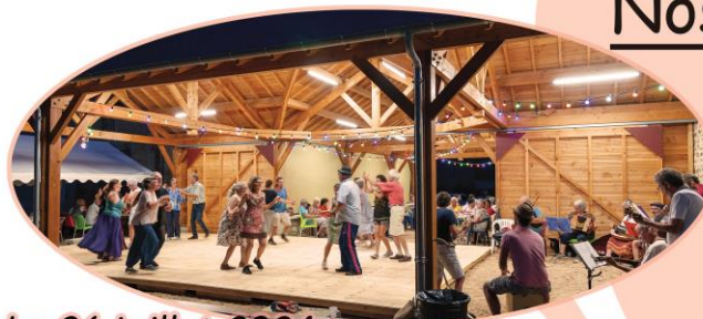
Le 26 juillet 2024 Avec Tisane Pop et Trad'Adi