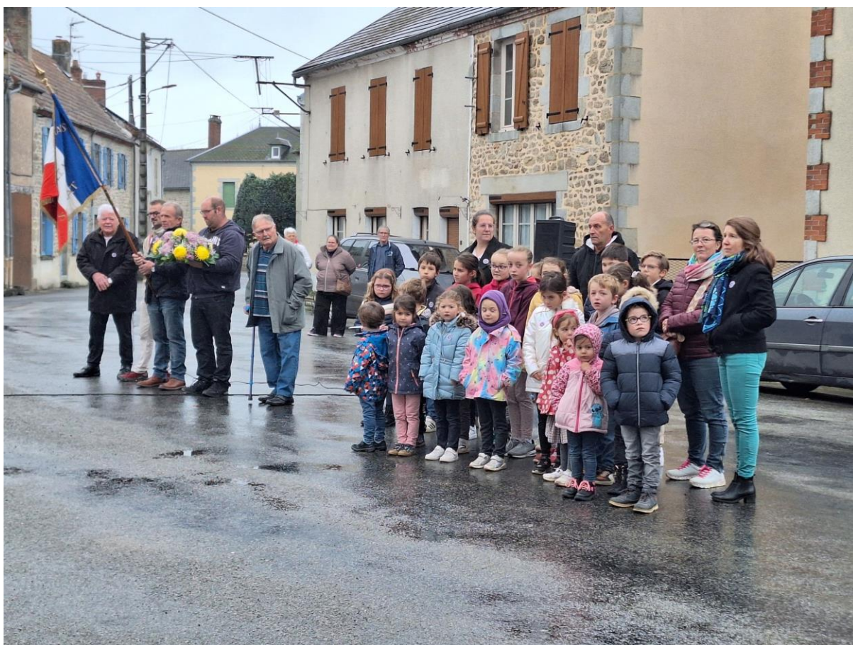
Photo de la cérémonie du 11 novembre 2024