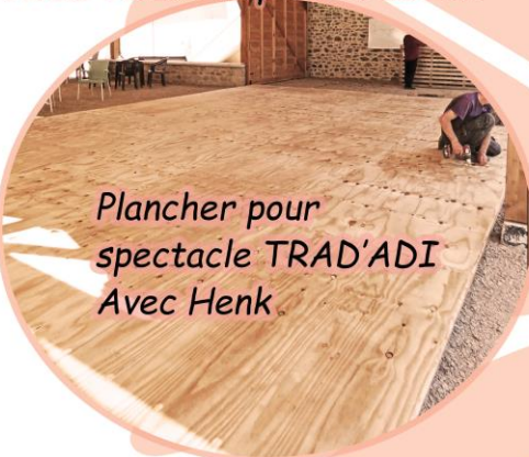
Plancher pour spectacle TRAD'ADI Avec Henk